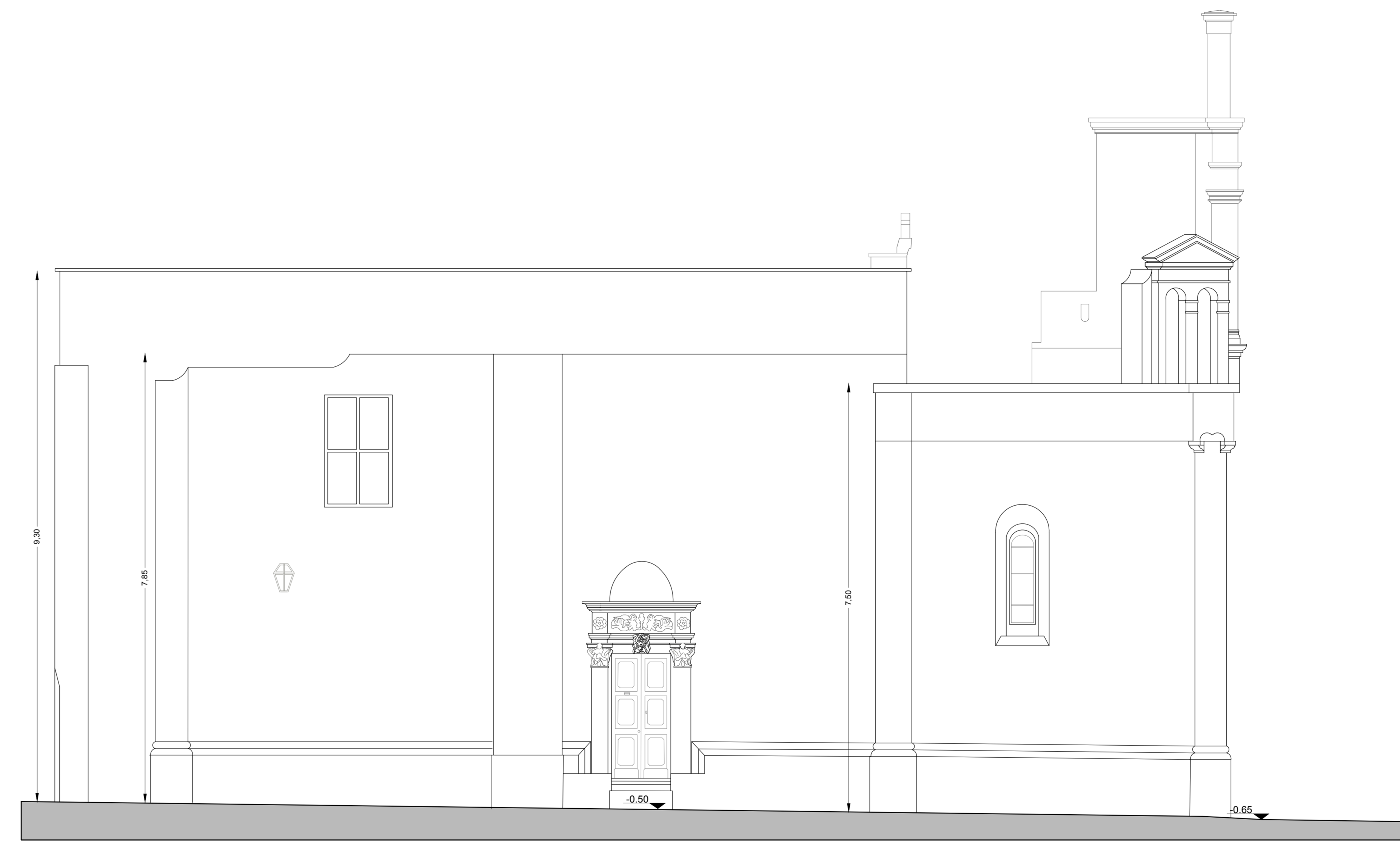
PROSPETTO SU VIA TEMPIO ANTICO