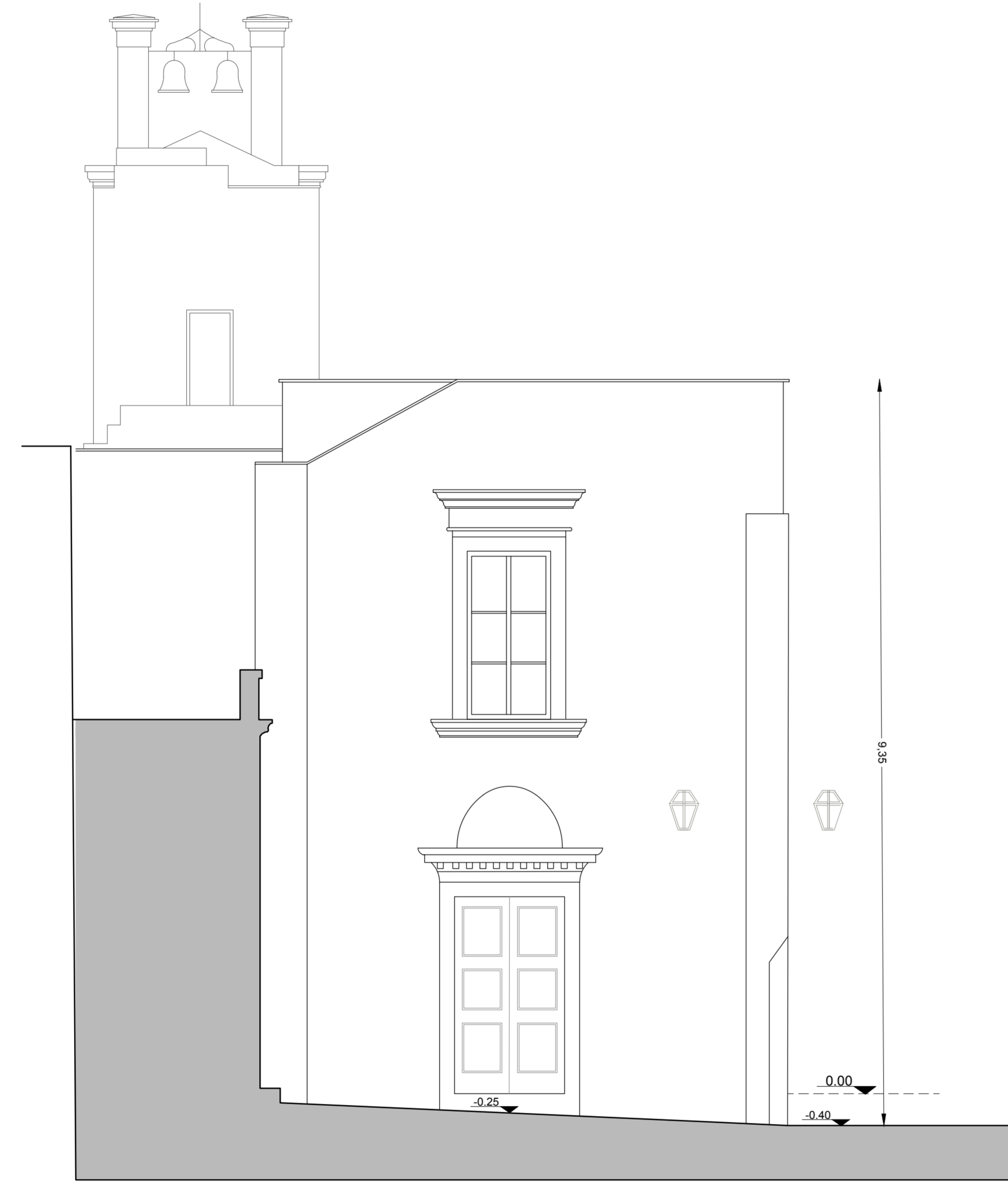
PROSPETTO SU VIA TEMPIO ANTICO (lato corte)